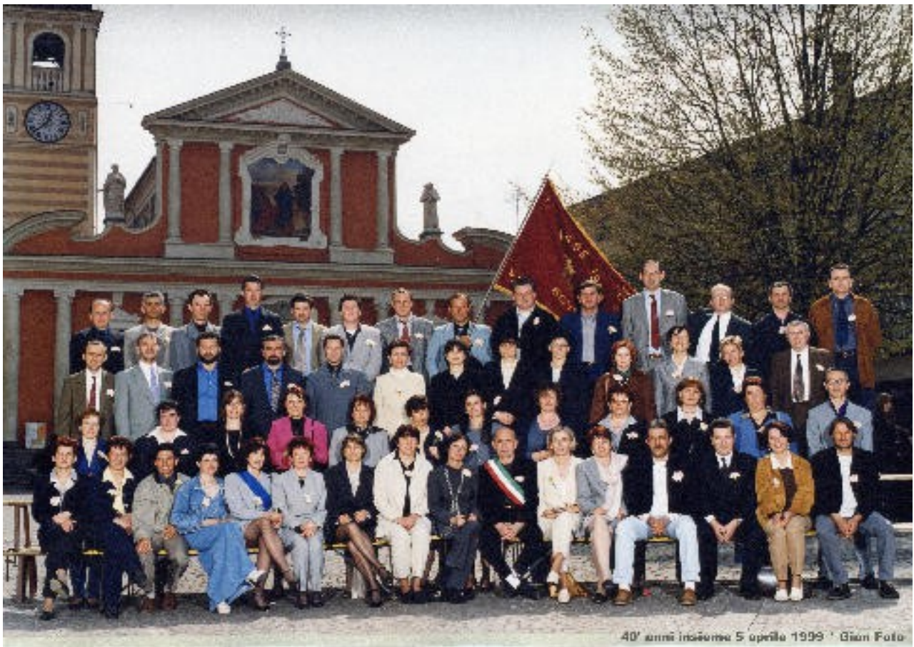
40' anni insieme 5 aprile 1999